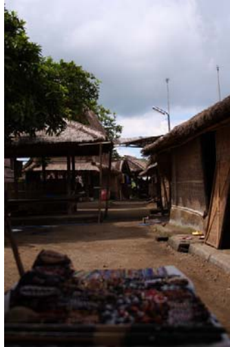
Gambar 2.10. Kampung Sade

Dihuni oleh sekitar 130-200 kepala keluarga, dengan jumlah penduduk kurang lebih 700 orang dan sebagian besar memiliki mata pencaharian yaitu sebagai petani. Di Lombok, kampung Sade menjadi objek budaya karena penduduk selalu menyajikan atraksi-atraksi atau fungsi simbol-simbol yang menekankan Sade sebagai kampung tradisional, seperti arsitektur rumah tradisional, musik tradisional, tari-tarian dan seni kerajinan. Sade memiliki daya tarik yaitu seni kerajinan tenun ikat dan pertunjukkan tari.