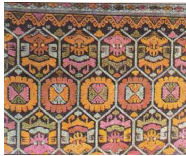
Gambar 2.9. Ragam Hias Taman Barong

Keterangan : Ragam hias taman barong berupa motif hias geometris segi enam. Di dalam segi enam tersebut diberi motif barong (kala), daun dan bunga. Dan pada tepi kain diberi hiasan garis motif kuta mesir bercorak belah ketupat (Handayani Usri Indah et al. 38).