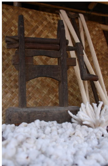
Gambar 2.2. Golong

Selain alat tenun dan sebelum pekerjaan menenun, yang harus dipersiapkan juga ialah benang yang akan ditenun, sebelum benang pabrik banyak diperjual-belikan secara luas di pasaran, pada umumnya penenun juga memintal sendiri benang tenunannya dengan peralatan yang masih sederhana. Alat-alat yang dipakai ialah :