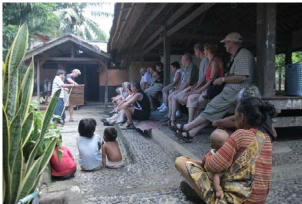
Gambar 2.11. Wisatawan kampung Sade

Dihuni oleh sekitar 130-200 kepala keluarga, dengan jumlah penduduk kurang lebih 700 orang dan sebagian besar memiliki mata pencaharian yaitu sebagai petani. Di Lombok, kampung Sade menjadi objek budaya karena penduduk selalu menyajikan atraksi-atraksi atau fungsi simbol-simbol yang menekankan Sade sebagai kampung tradisional, seperti arsitektur rumah tradisional, musik tradisional, tari-tarian dan seni kerajinan. Sade memiliki daya tarik yaitu seni kerajinan tenun ikat dan pertunjukkan tari.