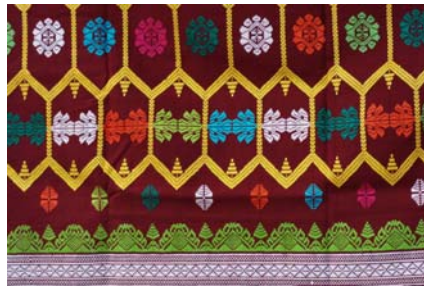
Gambar 2.5. Ragam Hias Subahnalle

Keterangan : ragam hias Subahnalle berupa motif hias geometris-segi enam, memenuhi bidang kain. Di dalam segi enam diberi hiasan motif kembang remawa, tunjung (bunga lotus), dan panah. Pada tepi kain diberi hiasan motif kuta mesir bercorak belah ketupat (Handayani Usri Indah et al. 42)