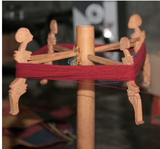
Gambar 2.3. Andir

Keterangan : Andir/pengompoq untuk menggulung benang yang akan ditenun.