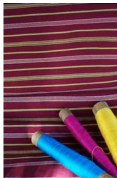
Gambar 2.8. Ragam Hias Batang empat

Keterangan : ragam hias batang empat berupa corak garis melintang horizontal. Kain dengan ragam hias ini dikenal dengan kain selulut. Umumnya berwarna dasar merah kecoklatan.