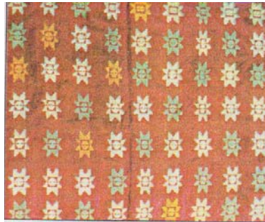
Gambar 2.7. Ragam Hias Bintang Empat

Keterangan : ragam hias bintang empat berupa corak kotak-kotak atau disebut juga corak catur. Di dalam kotak-kotak tersebut terdapat motif hias bintang. Dan tepi kain terdapat hiasan motif tumpal (Handayani Usri Indah et al. 40).