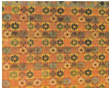
Gambar 2.6. Ragam Hias Remawa

Keterangan : Ragam hias Remawa berupa corak kotak-kotak yang diciptakan dengan menenun lungsi dan pakan yang warnanya berbeda. Di dalam kotak-kotak tersebut diberi hiasan motif bunga remawa dipadukan dengan motif kupu-kupu. Kain songket ini biasanya dikenakan oleh para gadis (Handayani Usri Indah et al. 38).