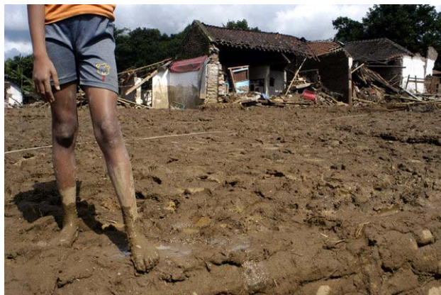
Gambar 2.12. Foto Etnofotografi “Luluh lantah”