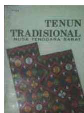
Gambar 2.14. Buku Tenun Tradisional

Analisa SWOT pada perancangan buku ini adalah mengambil sample buku tenun dengan judul Tenun Tradisional Nusa Tenggara Barat yang diterbitkan oleh Departemen Pendidikan Nasional Nusa Tenggara Barat. Dan hasil kajian analisa tersebut diuraikan sebagai berikut :