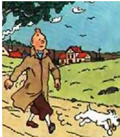
Gambar 2.2. Komik Eropa “Tintin”

Di Eropa, pada tahun 1929, muncul sebuah karya komik yang fenomenal, berjudul “Tintin” karya Herge, seorang komikus Belgia. “Tintin” yang memiliki genre drama petualangan, mampu mendominasi pasar hingga tahun 1970-an. Gaya gambar komik Eropa lebih bersifat ikonis, gambar-gambar yang ada merupakan penyederhanaan dari bentuk nyatanya.