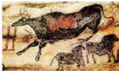
Gambar 2.1. Dinding prasejarah gua Lascaux

Prancis dikenal sebagai pencetus ide-ide komik cemerlang, sejarah komik bermula pada masa pra sejarah digua Lascaux, Prancis selatan, ditemukan torehan berupa gambar gambar bison, jenis banteng atau kerbau Amerika. Cikal bakal komik ini belum mengandung sandi yang membentuknya menjadi bahasa namun sudah merupakan "pesan" sebagai upaya komunikasi non verbal paling kuno.