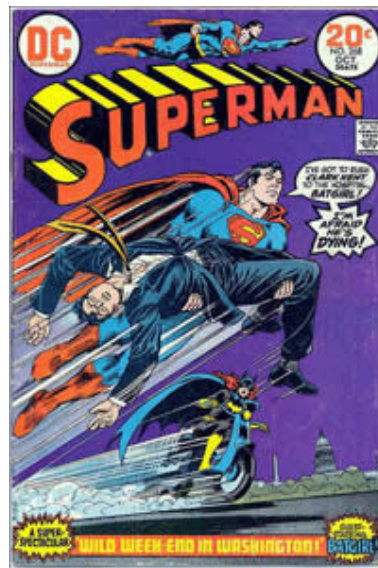
Gambar 2.4. Komik Amerika Superman

komikus terkenal Stan Lee, dimana tema superhero yang ada semakin beragam, misalnya “Spiderman”, “Hulk”, “Captain America”, “DareDevil” dan sebagainya.