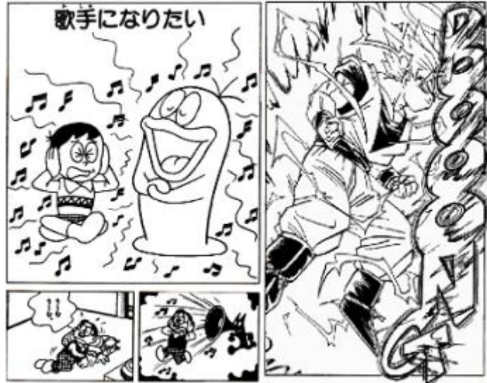
Gambar 2.5. Komik Manga Jepang