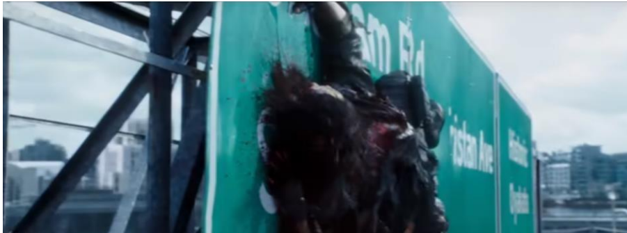
Gambar 2.1 korban dibunuh dengan badan yang hancur

Berbanding terbalik dengan karakter Deadpool yang juga anti-hero tapi aksi dari deadpool sendiri terkesan penuh hiburan dan kekerasan dimana-dimana, baik itu kekerasan verbal seperti kata-kata kotor, dan juga kekerasan nonverbal baik itu menusuk, memotong organ badan, menembak yang terkesan sangat sadistik.