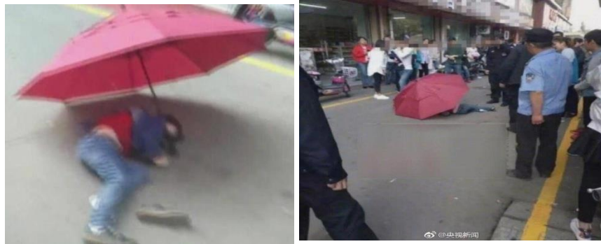
Gambar 1.4 Anak yang melompat keluar jendela menggunakan payung 2018