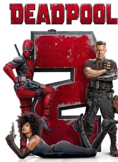
Gambar 2.4 Poster Deadpool 2

Tetapi berdasarkan salah satu portal berita Republika film Deadpool sempat dilarang peredarannya di negeri tirai bambu itu karena tidak mendapat persetujuan impor dari regulator Cina dan gagal disertakan sebagai kuota bagi hasil tahunan. Namun, akhirnya film tersebut akan tampil perdana di Middle Kingdom yang berlangsung mulai dari 15 hingga 22 April 2018 bersamaa dengan sequel dari Deadpool 1 yaitu Deadpool 2 , dan kedua film ini ditayangkan tidak menggunakan sensor apa pun.