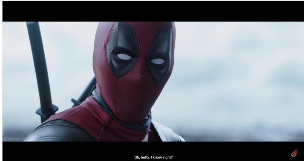
Gambar 1.8 Deadpool berbicara langsung dengan penonton ( FourthWall )

Dari observasi awal, peneliti menemukan bahwa hal yang menarik dari karakter Deadpool adalah walaupun dia dicap sebagai pahlawan super, akan tetapi perilaku yang dia perlihatkan sama sekali tidak mencerminkan bahwa dia adalah seorang pahlawan super. Deadpool bisa juga dikatakan sebagai anti-hero, karena dia berada di wilayah abu-abu. Karakter ini mempunyai keunikan tersendiri yang 4 membuatnya berbeda dengan superhero lainnya( Idn Times, Hadrito, 2019).