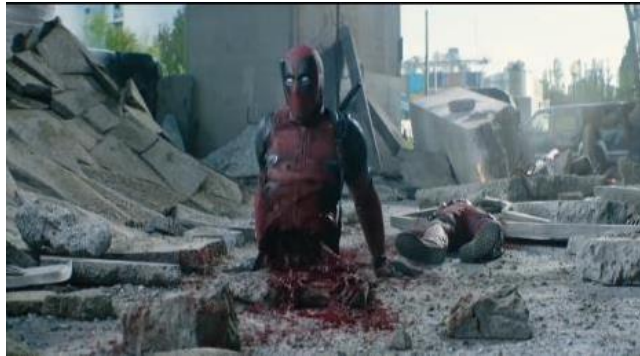
Gambar 2.5 Kekerasan yang mendetail yang tidak disensor

Film Deadpool 2 sukses mendapatkan penghargaan Best Edited Feature Film & dan Grammy awards Best Compilation Soundtrack for Visual Media pada tahun 2019, dan Best Comedy of the Year, Best DVD/Blu-Ray of the Year, Coolest Character of the Year 'Cable' pada tahun 2018 dan meraih pendapatan untuk sekuel yang disutradarai David Leitch ini menjadi US$344 juta (Rp4,7 triliun) di domestik Amerika Utara dan US$598 juta (Rp8,2 triliun) secara global (IMDB,2019)