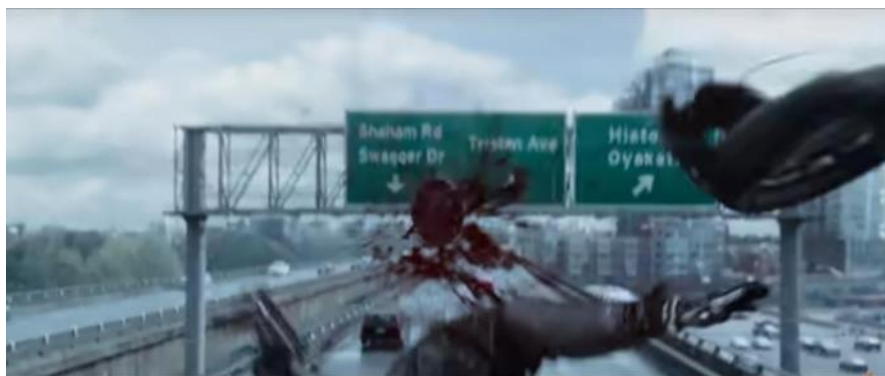
Gambar 2.2 korban dibunuh dengan kepala terpotong