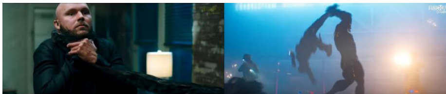
Gambar 2.1 korban kekerasan mencekik dalam film Deadpool