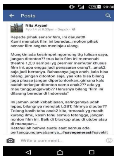
Gambar 1.6 Pendapat masyarakat mengenai film Deadpool