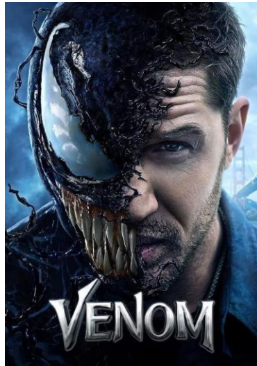
Gambar 1.9 Poster Venom 2018

Jika dibandingkan dengan film anti-hero seperti Venom yang disutradarai oleh Ruben Fleischer, yang merupakan film bagian dari Marvel Studio dan Marvel Comics , Venom meraih pendapatan total sebesar 783,8 juta dollar Amerika (IMDB, 2018)