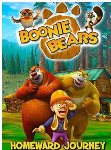
Gambar 1.3 Gambar kartun Boonie Bears