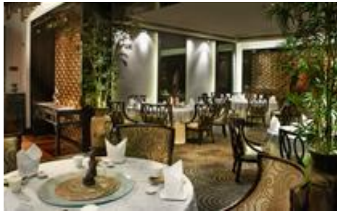
Gambar 4.6 Interior Tien Chao

Tien Chao, yang diterjemahkan sebagai tempat bahagia berada pada lokasi Gran Melia Hotel, Jl. H.R. Rasuna Said Kav. X-O, Kuningan, yang merupakan nama sebuah restoran di Jakarta. Restoran ini menawarkan masakan khas dari Cina : Kanton dan Szechuan. Dimana masakan Kanton berasal dari Guangdong, Provinsi di Cina Selatan dan hal ini bias dibilang, sebagian besar makanan ini telah terkenal bahkan di luar Cina. Sedangkan masakan Szechuan berasal dari Provinsi Sichuan di Cina barat daya dan biasanya ditandai dengan rasa yang kuat dan penggunaan liberal dari bawang putih, cabe dan Sichuan lada pada hidangan.