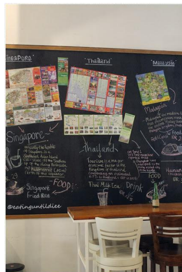
Gambar 4.2 Information Board