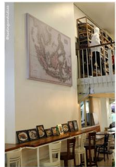
Gambar 4.3 Interior Mamak Kitchen