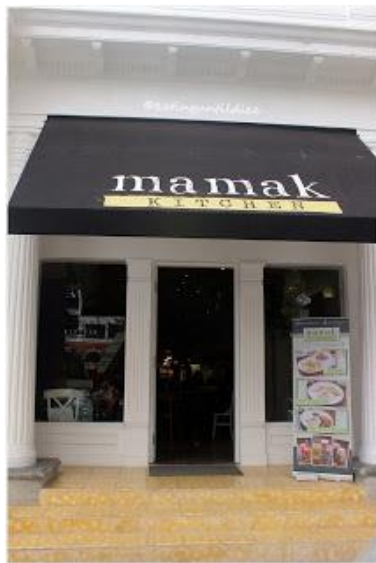
Gambar 4.1 Main Entrance Mamak Kitchen

Nuansa homey dan nyaman diciptakan agar pengunjung yang datang singgah kesini bisa merasa relax setelah lelah berbelanja. Warna putih yang menenangkan mendominasi keseluruhan interior resto. Konsep restoran ini cenderung menggabungkan kafe dengan restoran. Menu-menu yang ditawarkan pun menawarkan aneka ragam makanan ringan yang cocok sebagai teman bersantai.