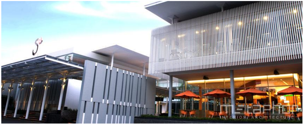
Gambar 4.4 Main Entrance S2 Sisingamangaraja