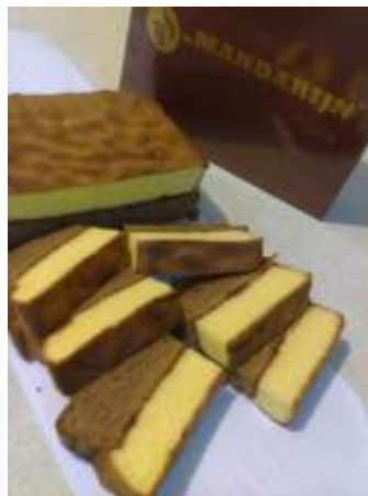
Gambar 2.43 Roti Mandarijn “ORION”

“ORION” sendiri sebenarnya adalah nama toko yang menjual roti mandarin pertama di kota Surakarta. Selain roti mandarin, toko roti orion menjual berbagai makanan mulai dari jajanan pasar, roti basah, permen, hingga snack yang biasa dijual di toko-toko.