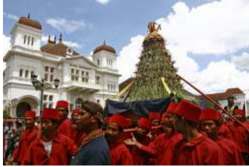
Gambar 2.13 Sekaten