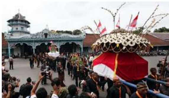
Gambar 2.19 Grebeg Besar

Grebeg Besar berlangsung pada hari Idul Adha (tanggal 10 Besar). Upacara sama dengan prosesi Gunungan pada Grebeg Pasa dan Grebeg Mulud, dimana didalamnya juga terdapat acara sekaten selama 2 minggu.