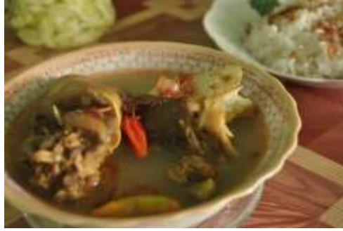
Gambar 2.31 Tengkleng