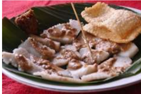
Gambar 2.23 Cabuk Rambak

dari beras, yang kemudian dipotong kotak-kotak, dan dihidangkan dengan siraman bumbu yang terbuat dari kelapa dan wijen. Cabuk rambak dihidangkan dengan karak.