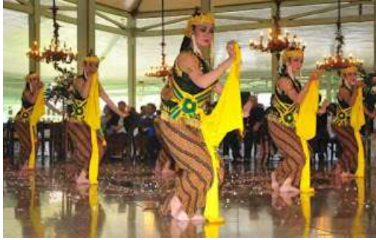
Gambar 2.16 Tari Bedoyo Ketawang