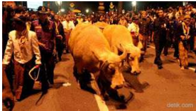
Gambar 2.12 Kirab Kebo Bule