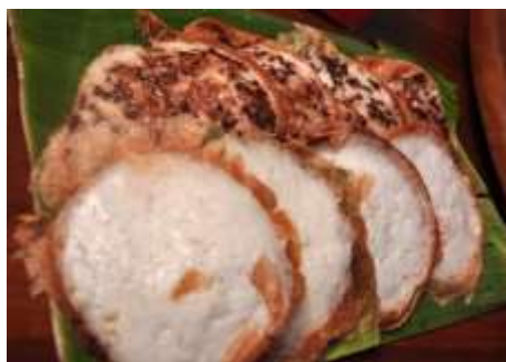
Gambar 2.40 Serabi Solo

Serabi ini hanya ditemukan di Surakarta, walaupun mulai banyak ada di kota-kota lain, tetapi serabi ini merupakan makanan asli Surakarta. Serabi ini berbeda dengan serabi jajanan pasar yang sering kita jumpai. Untuk mengkonsumsinya serabi Solo tidak perlu menggunakan kuah, dibuat dengan bahan dasar santan, membuat rasa gurih sangat terasa saat mengigitnya, membuat makanan ini banyak diminati oleh wisatawan dari luar Surakarta.