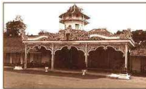
Gambar 2.1 Keraton Solo tempo doelo

tanah bekas galian itu membentuk danau kecil yang setelah ratusan tahun dijadikan Balai Kambang Sriwedari. Seluruh bangunan inti keraton Kasunanan Kartasura diangkut pindah untuk didirikan kembali di desa Sala. Pada waktu itu pagar kompleks keraton dibuat dari bambu, secara bertahap bagian-bagian keraton lainnya seperti Masjid Agung di alun-alun utara pun dibangun oleh generasi Pemerintahan Paku Buwono selanjutnya, karena keberadaan bangunan tersebut sangat erat kaitannya dengan kehidupan keraton Surakarta.