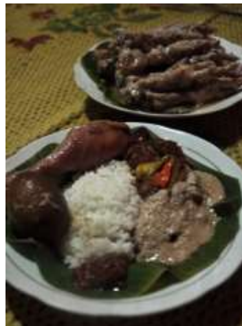
Gambar 3.37 Gudeg Ceker Solo

Kurang rasanya jika memesan gudeg tanpa ceker ayam yang dimasak dengan santan areh, ceker ini sangat lunak dan halus, jadi saat masuk kedalam mulut daging dan tulang akan terlepas secara tersendiri.