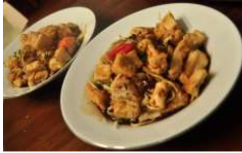
Gambar 2.35 Tahu Kupa