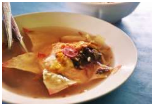
Gambar 2.27 Sop Matahari

Sup matahari berisikan cacahan daging, wortel, jamur kuping, bihun, jagung dan sosis yang kemudian dibungkus dalam telur dadar yang tipis, kemudian