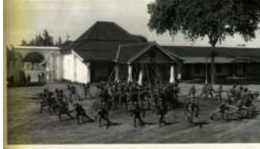
Gambar 2.2 Mangkunegaran tempo doeloe