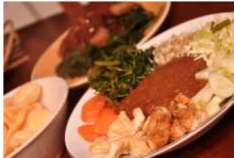
Gambar 2.39 Lotek

Lotek di Surakarta biasanya dijual bersamaan dengan gado-gado, lotek adalah makanan yang berisikan tahu dan tempe goreng dipotong kotak-kotak, wortel rebus, bayam rebus, timun, toge, dan kobis yang dicampur kemudian diberi saos kacang sama seperti saos gado-gado, dan disajikan dengan krupuk diatasnya.