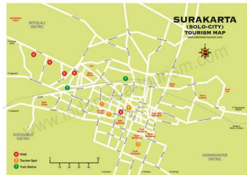
Gambar 2.3 Peta kota Surakarta