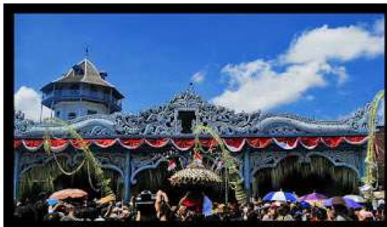
Gambar 2.15 Grebeg Mulud

Grebeg Mulud diadakan pada setiap tanggal 12 Mulud untuk memperingati hari Maulud Nabi Muhammad SAW. Grebeg Mulud merupakan bagian dari perayaan Sekaten. Dalam upacara ini para abdi dalem dengan berbusana "Jawai Jangkep Sowan Keraton" mengarak Gunungan ( Pareden ) dari Keraton Surakarta ke Masjid Agung Surakarta. Gunungan terbuat dari berbagai macam sayuran dan panganan tradisional. Setelah didoakan oleh Ngulamadalem (Ulama Keraton), satu buah Gunungan kemudian akan diperebutkan oleh masyarakat pengunjung dan satu buah lagi dibawa kembali ke Keraton untuk dibagikan kepada para abdi dalem.