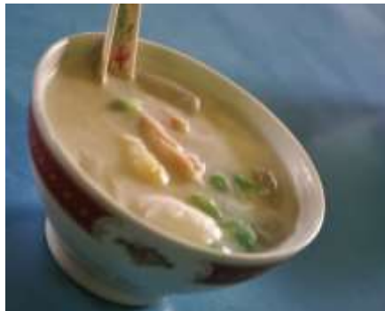
Gambar2.24 Es Gempol Pleret