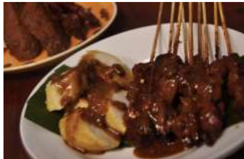
Gambar 2.34 Sate Kere

Mengapa diberi nama sate kere? Konon sate ini hanya berisi tempe gembus saja, yang harganya relatif murah, bahkan tempe gembus lebih murah dibanding tempe kedelai. Selain itu sate kere biasa dikonsumsi oleh orang-orang miskin (dalam bahasa Jawa : kere), maka dari itulah disebutnya dengan sebutan sate kere.