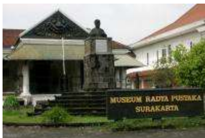
Gambar 2.7 Museum Radya Pustaka

Museum Radya Pustaka terletak di Jalan Slamet Riyadi, bertempat didalam kompleks Taman Wisata Budaya Sriwedari. Di museum ini tersimpan koleksi benda-benda kuno yang mempunyai nilai seni dan sejarah tinggi, antara lain : Beberapa arca batu dan perunggu dari zaman Hindu dan Budha. Koleksi keris kuno dan berbagai senjata tradisional, seperangkat gamelan, wayang kulit & wayang beber, koleksi keramik dan berbagai barang seni lainnya. Museum Radya Pustaka buka pada hari Selasa sampai Minggu jam 8.30-13.00.