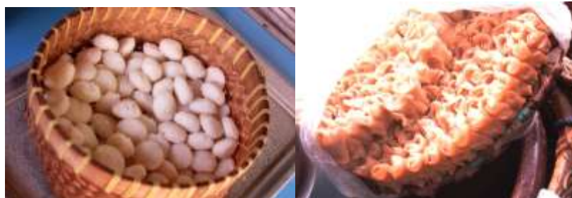
Gambar 2.25 Gempol dan Pleret

Es Gempol Pleret adalah minuman sejenis dengan es dawet, hanya saja yang menjadi perbedaan es dawet ini dengan dawet yang lainnya adalah dalam es ini terdapat gempol dan pleret yang terbuat dari tepung beras, selain itu juga terdapat