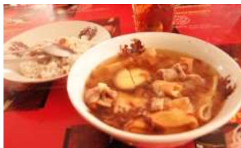
Gambar 2.33 Timlo Solo