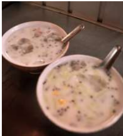
Gambar 2.36 Dawet Selasih

Es dawet selasih ini seperti dawet pada umumnya, hanya saja yang membedakan adalah gula yang digunakan. Jika dawet yang lainnya menggunakan gula jawa sebagai pemanis, dawet selasih menggunakan gula pasir sehingga warna dari dawet ini putih tidak coklat seperti dawet pada umumnya. Selain itu isi dawet ini adalah cendol (berwarna hijau), tape beras ketan, ketan hitam, bubur sumsum, potongan buah nangka, santan dan yang spesial adalah menggunakan selasih, selasih adalah biji dari bunga daun kemangi yang berbetuk butiran-butiran kecil hitam yang dibuat dengan disedu air panas terlebih dahulu. telasih mampu menyembuhkan penyakit panas dalam dan sariawan.