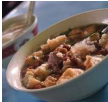
Gambar 2.26 Bakmi Toprak

Bakmi toprak adalah salah satu kuliner dari kota Surakarta yang banyak diminati oleh wisatawan maupun masyarakat kota Surakarta sendiri. Bakmi toprak makanan yang berisikan bakmi kuning, bihun, kobis, tauge rebus, tempe dan tahu yang sudah digoreng, sosis telur yang dipotong-potong, daging dan kikil sapi, cakwe, bakwan sayur, kemudian disiram dengan kuah kaldu sapi, kemudian ditaburi dengan kacang tanah dan brambang goreng.