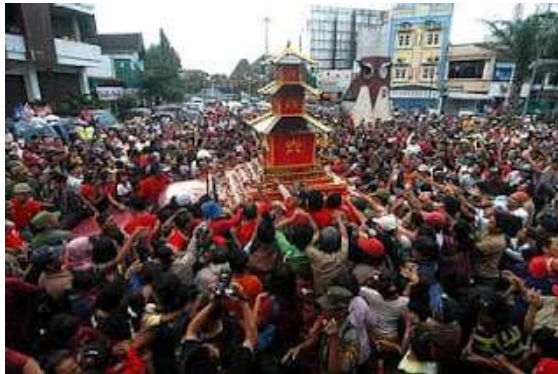
Gambar 2.14 Grebeg Sudiro