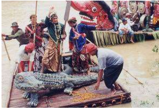
Gambar 2.18 Syawalan

menceritakan perjalanan Jaka Tingkir saat melewati kali Bengawan Solo. Dan puncak acaranya yaitu "Larung Getek Jaka Tingkir" pada acara itu diadakan pembagian ketupat pada masyarakat pengunjung. Selain itu pada acara syawalan juga diadakan berbagai macam pertunjukan kesenian tradisional.