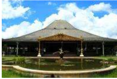
Gambar 2.8 Pura Mangkunegaran