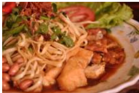
Gambar 2.29 Bakmi Acar

Bakmi acar makanan yang cukup populer di kota Surakarta, bakmi acar adalah makanan yang berisikan sesuai dengan namanya yaitu bakmi dan acar, ditambah dengan kobis, toge yang sudah direbus, tahu dan tempe goreng, kacang