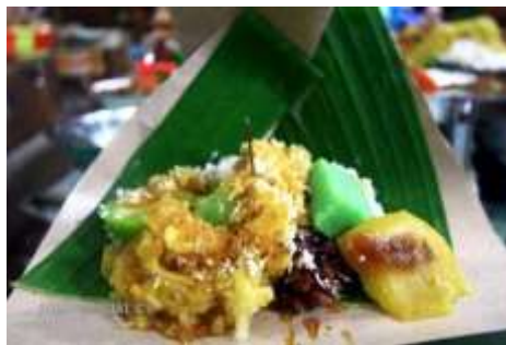
Gambar 2.41 Lenjongan

Hampir semua bahan pembuatan lenjongan terbuat dari tepung beras, beras dan singkong yang diparut / singkong yang dipotong kecil-kecil.