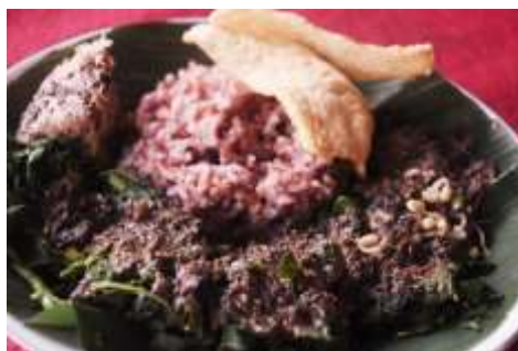
Gambar 2.22 Pecel Ndeso

Pecel ndeso berbeda dengan pecel-pecel yang ada di daerah lainnya. Yang menjadi keunikan dari pecel ini adalah pecel ini menggunakan nasi merah yang berasal dari beras merah, dengan sayuran yang terdiri dari daun pepaya (rasanya tidak pahit), tuntut pisang, bayam, taoge, dll dengan ditambah karak dan disiram dengan bumbu yang terbuat dari wijen hitam, yang membedakan dengan pecel lain yaitu bumbu kacang.