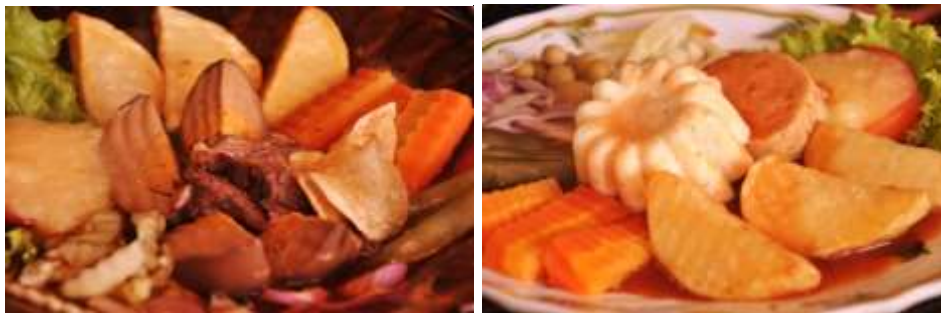
Gambar 2.28 Selat Solo dan Selat Galantin

Sedangkan selat galantin merupakan fusion dari selat Solo. Dengan isi yang hampir sama dan yang membedakan adalah di selat galantin terdapat kacang polong, daging sapi diganti dengan galantin sapi (daging sapi yang dicacah) dan telur ayam kukus yang dibentuk seperti bunga.