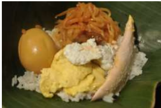
Gambar 2.30 Nasi Liwet

Untuk penyajiannya, nasi liwet biasa dihidangkan dengan ayam suir, telur pindang, kuning telur yang dicampur santan saat pembuatannya, areh / putih telur yang pembuatannya dicampur dengan santan, sayur labusiam.