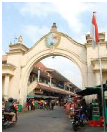
Gambar 2.11 Pasar Klewer

Tak hanya pakaian, banyak prodak kuliner khas Surakarta juga tersedia di sekitar pasar ini seperti timlo Solo, bakso Solo, tengleng, es Gempol pleret, dll.