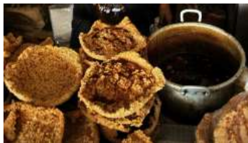
Gambar 2.42 Intip Solo

Sumber : http://wisatajiwa.files.wordpress.com/2010/01/pasar-gede-solo-8.jpg