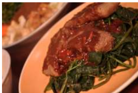
Gambar 2.38 Brambang Asem

Brambang asem terbuat dari bayam yang direbus hingga setengah matang, tempe gembus yang dipotong memanjang, kemudian disiram dengan saos yang terbuat dari gula jawa dan cabai, sehingga rasa yang ditimbulkan pedas manis.