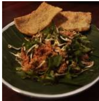
Gambar 2.32 Trancam

Trancam adalah makanan yang menyerupai urap, hanya saja yang membedakan adalah semua sayuran yang ada mentak, tidak dikukus terlebih dahulu. Sayuran yang adapun hampir sama dengan urap diantaranya toge, daun kemangi, mentimun, daun kenikir, dan mlanding.