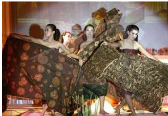
Gambar 2.21 Solo Batik Fashion