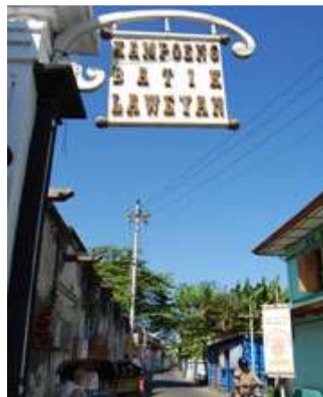
Gambar 2.10 Kampoeng Batik Laweyan