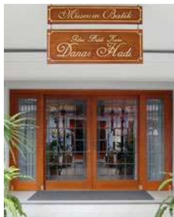
Gambar 2.9 Museum Batik Kuno Danar Hadi