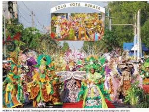
Gambar 2.20 Solo Batik Carnival

sebagai bahan utama pembuatan kostum. Para peserta karnaval akan membuat kostum karnaval dengan tema-tema yang di tentukan. Para peserta akan mengenakan kostumnya sendiri dan berjalan di atas catwalk yang berada di jalan Slamet Riyadi. Karnaval ini diadakan setiap tahun pada bulan Juni sejak tahun 2008.