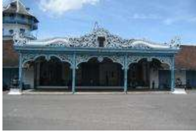
Gambar 2.6 Keraton Kasunanan Surakarta