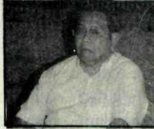
Ket. foto: Gus Dur dalam Radikal di Auditorium UK Petra. "Mencoba untuk mencairkan kebekuan".

(baca: Gus Dur) tokoh puncak NU di Auditorium UK Petra beberapa waktu lalu menunjukkan perkembangan positif dalam kehidupan kemahasiswaan kita.